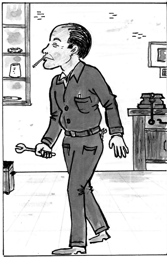
En Tubau (1948).

altura normal. A dins hi havia un munt d'andròmines i un banc de fuster que semblava nou de trinca.